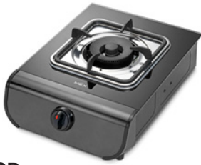
Table Top Gas Cooker : เตาแก๊สดั้งโต๊ะ