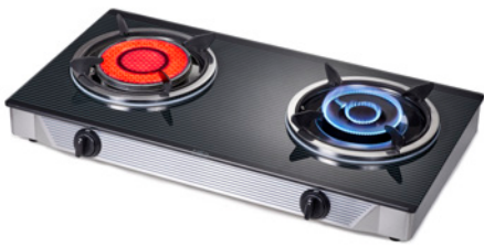
Table Top Gas Cooker : เตาแก๊สดั้งโต๊ะ